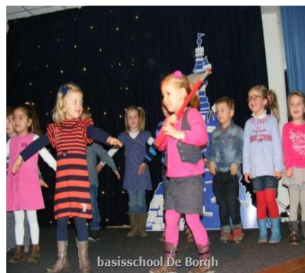
basisschool De Borgh Groep 1 zingt en maakt muziek!